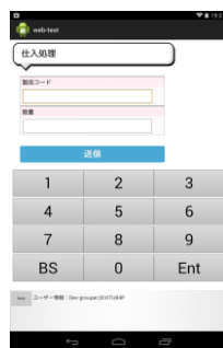
バーコードで商品コード入力 数値を入力